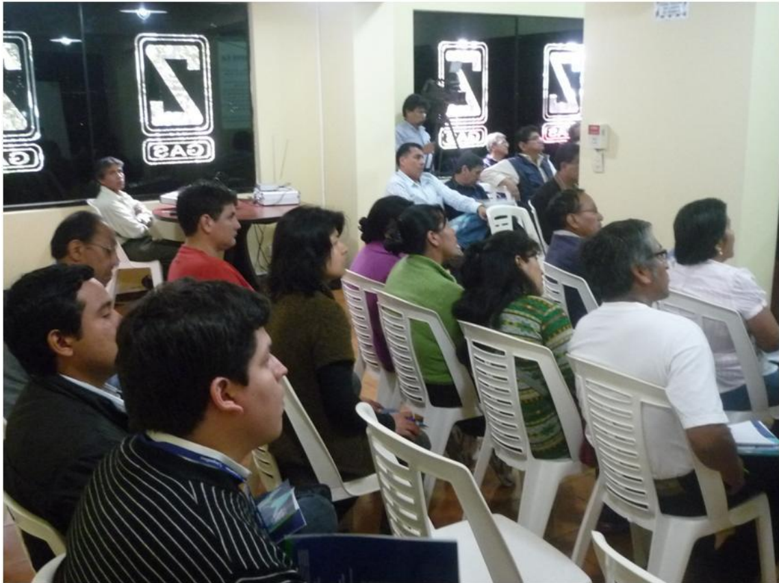
Fotografía 3.- Vista del Auditorio asistente al 2do Taller Informativo.