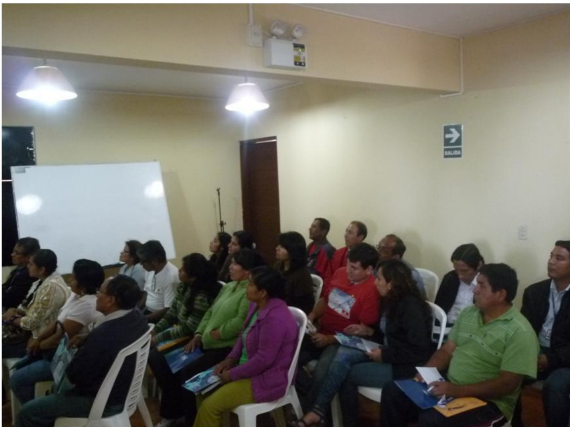
Fotografía 2.- Vista del Auditorio asistente al 2do Taller Informativo.