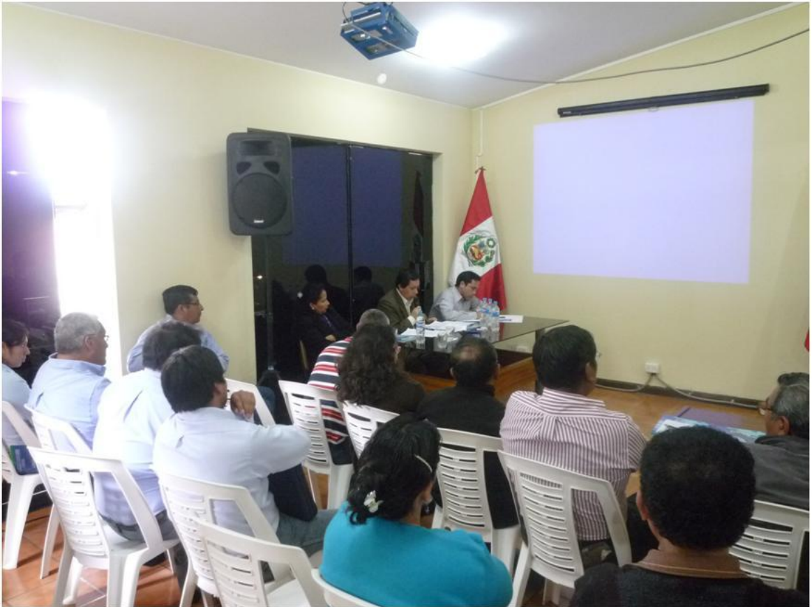
Fotografía 11.- Ronda de preguntas escritas.