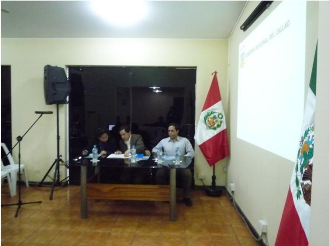
Fotografía 1.- Mesa Directiva del 2do Taller Informativo de Participación Ciudadana del Proyecto de Ampliación de la Planta de abastecimiento de Zeta Gas Andino S.A., realizado el 11/11/2011.