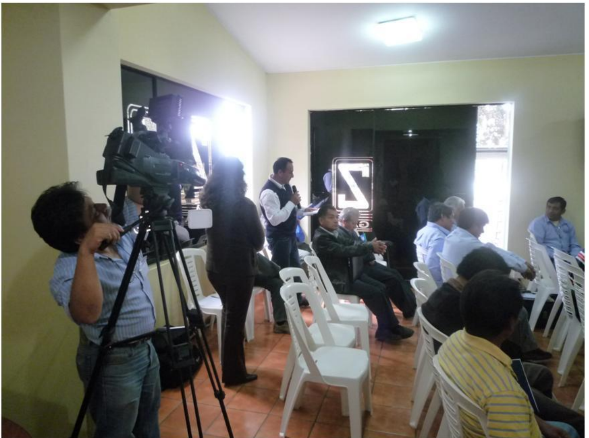
Fotografía 12.- Ronda de preguntas orales.