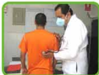
Se inicia Plan de visitas de especialistas en neumología, cardiología y endocrinología.