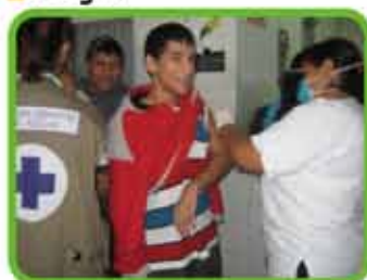
Campaña de vacunación contra la influenza.