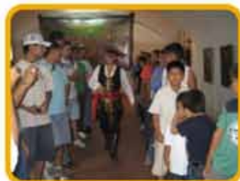
Real Felipe: paseos culturales con hijos de trabajadores e hijos de internos.