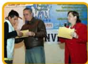
Día del Padre: fecha especial para entrega de indultos.