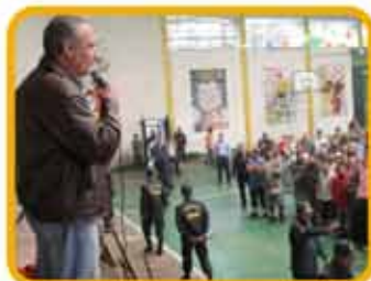
Visita a internos chalacos de los establecimientos penitenciarios de Lurigancho y Castro Castro.