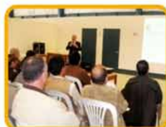
Jornadas de capacitación y de evaluación de planes de trabajo con trabajadores del Penal.