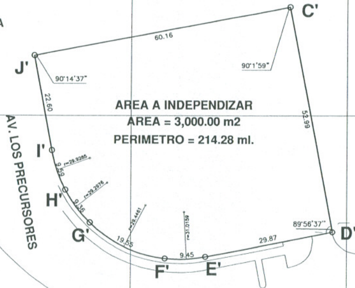
CUADRO DE DATOS TECNICOS DE AREA A INDEPENDIZAR

AREA A INDEPENDIZAR AREA = 3,000.00 m 2 PERIMETRO = 214.28 ml.