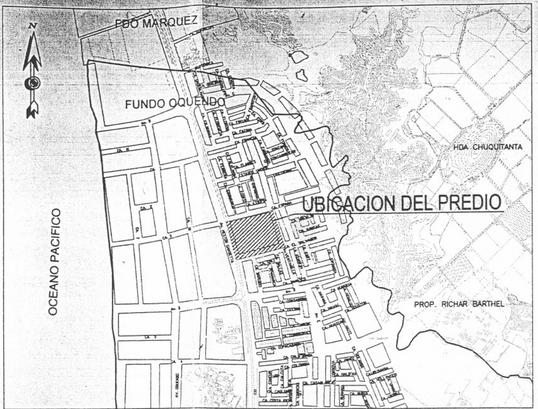
PLANO DE LOCALIZACION