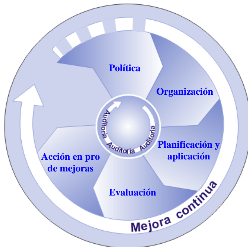
Gráfico 2. Principales elementos del sistema de gestión de la seguridad y la salud en el trabajo

La seguridad y la salud en el trabajo, incluyendo el cumplimiento de los requerimientos de la SST conforme a las leyes y reglamentaciones nacionales, son la responsabilidad y el deber del empleador. El empleador debería mostrar un liderazgo y compromiso firme con respecto a las actividades de SST en la organización , y debería adoptar las disposiciones necesarias para crear un sistema de gestión de la SST, que incluya los principales elementos de política, organización, planificación y aplicación, evaluación y acción en pro de mejoras, tal como se muestra en el gráfico 2.