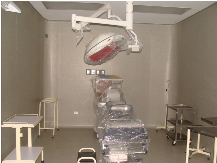
SALA DE PARTOS

En el primer nivel se encuentran 20 Consultorios (Medicina Interna, Dermatología, Reumatología, Cardiología, Neurología, Endocrinología, Cirugía General, Oftalmología, Traumatología, Gineco Obstetricia), 2 Salas de Operación, 1 Sala de Partos y Hospitalización de Neonatología.