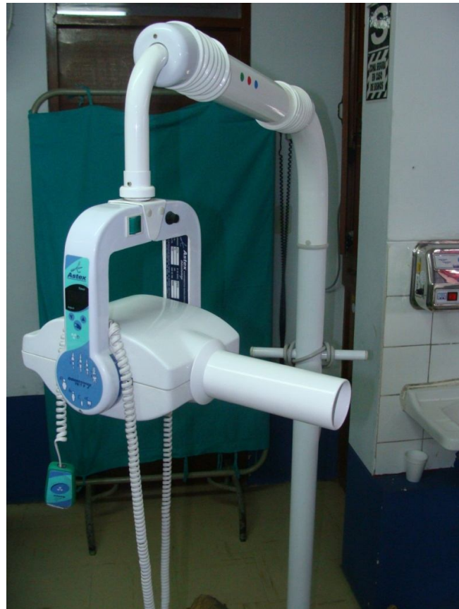
EQUIPO DE RAYOS X DENTAL