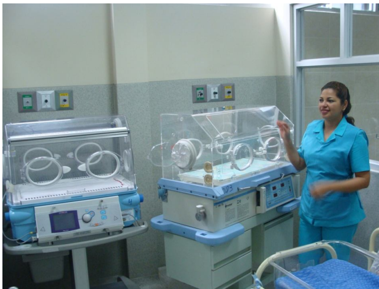
INCUBADORAS PARA RECIEN NACIDOS

La adquisición del Campímetro Computarizado, de última tecnología en el Callao permitirá a los profesionales en Oftalmología del Hospital "San José" brindar un nuevo servicio. Este equipo sirve para realizar evaluaciones y descarte de glaucoma, descarte de