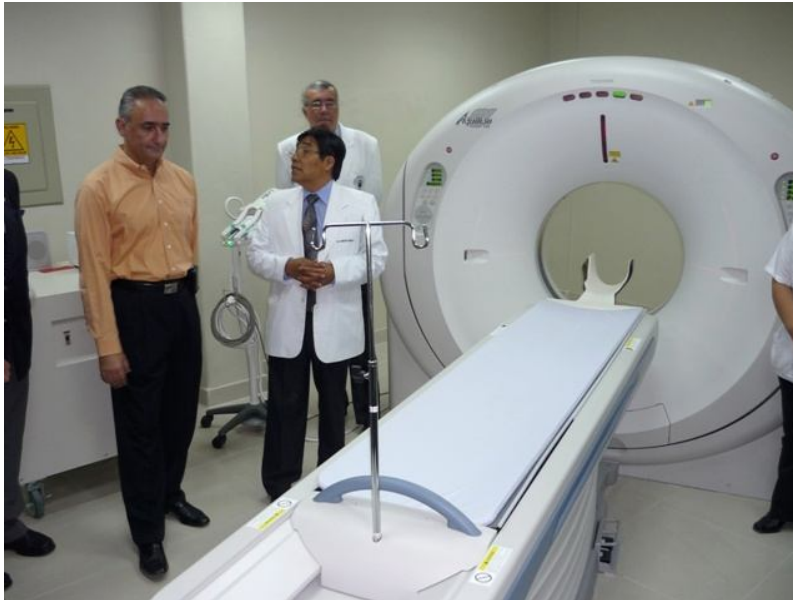
TOMOGRFO HELICOIDAL MULTICORTE