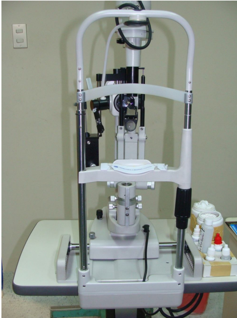
LAMPARA DE HENDIDURA

problemas neurológicos , entre ellos tumores de cerebro. Además, permite ver el campo visual de las personas y realizar todo tipo de estudios como por ejemplo: campo visual azul-amarillo, GAP (Análisis de Progresión de glaucoma), descarte de glaucoma. El costo aproximado de este equipo es de 180 mil nuevos soles.