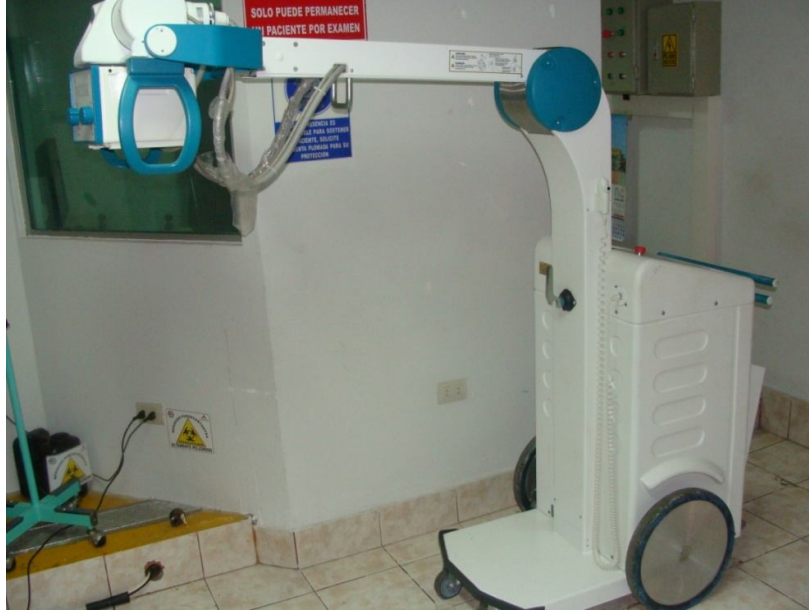
EQUIPO DE RAYOS X PORTATIL

“Decenio de las Personas con Discapacidad en el Perú” “Año de la Consolidación Económica y Social del Perú”