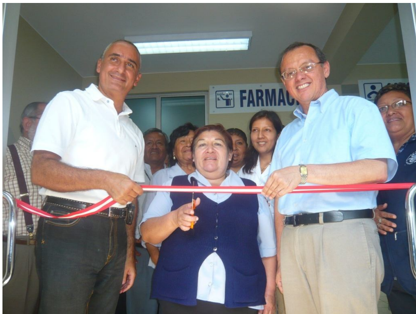
INAUGURACION DEL CENTRO DE SALUD "SAN JUAN BOSCO"