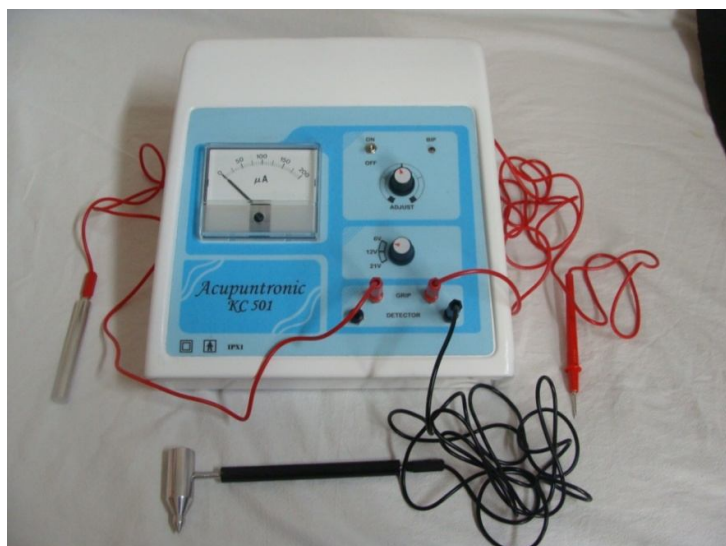
EQUIPO DE ELECTROACUPUNTURA

Esta nueva infraestructura estará equipada con un Video Procesador con cámara, Equipo para electroacupuntura, Camilla ergonómica de 3 secciones eléctrica, Camilla Quiropráctica con acelerador y accesorios, Monitor de Signos Vitales, Camas de Hospitalización, Incubadora para recién nacido de cuidados intensivos y Campímetro computarizado, por un monto total de 617 mil 785 nuevos soles, con presupuesto del Gobierno Regional de Callao.