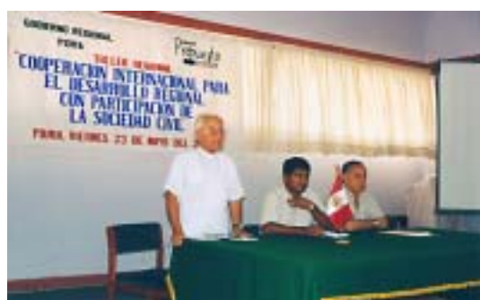
Piura: Cooperación internacional, años 1999 – 2001 (US$ millones)

civil y la cooperación internacional sobre la base de una agenda de desarrollo concertada. Participaron universidades, gremios empresariales, la Cámara de Comercio de Piura, la Iglesia y varias ONG.