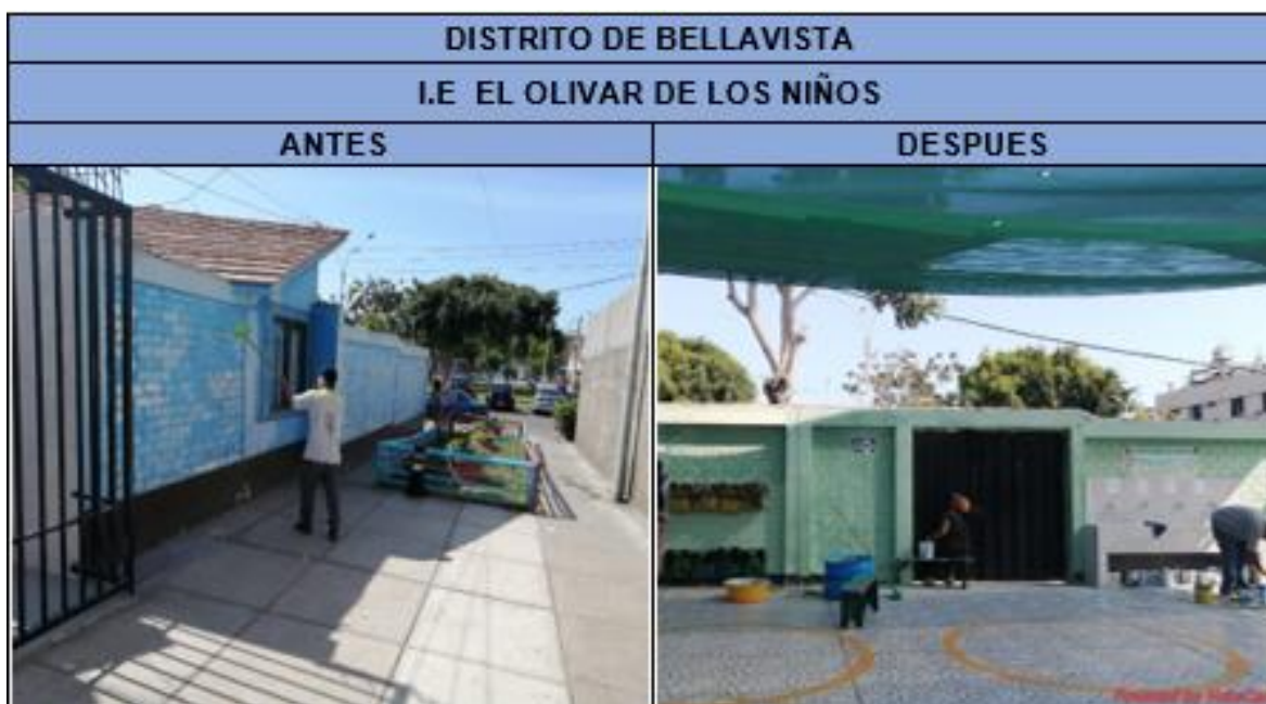
PANEL FOTOGRÁFICO DEL ANTES Y DESPUES DE AVANCES DE EJECUCIÓN

Aquellos colegios que muestran un nivel de ejecución mucho menor (algunos a nivel 0) obedece a razones de fuerza mayor externas a la voluntad de CAFED que esperamos pronto sean revertidas para dar cumplimiento a lo programado.