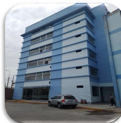
Centro de Investigación de Bioenergía y tecnologías ecológicas

La construcción se realizó sobre un área total de 204.40 m 2 cuenta con un sótano, seis pisos y una