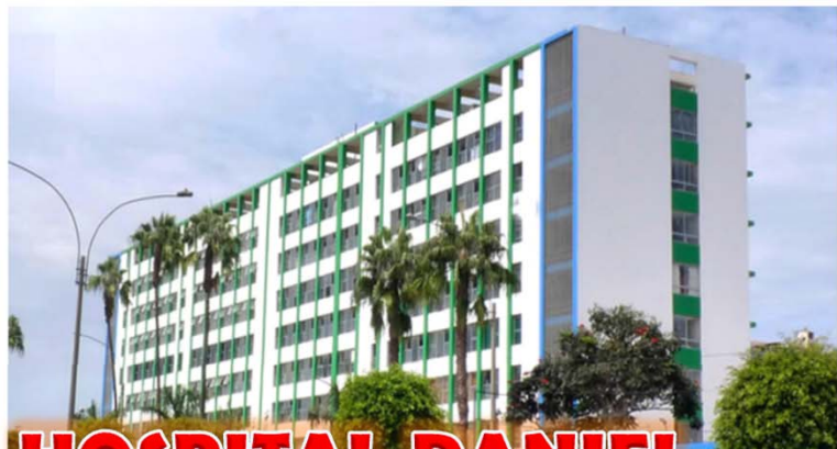
HOSPITAL DANIEL A. CARRIÓN