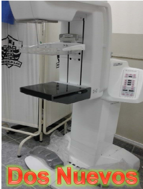
Dos Nuevos Mamografos