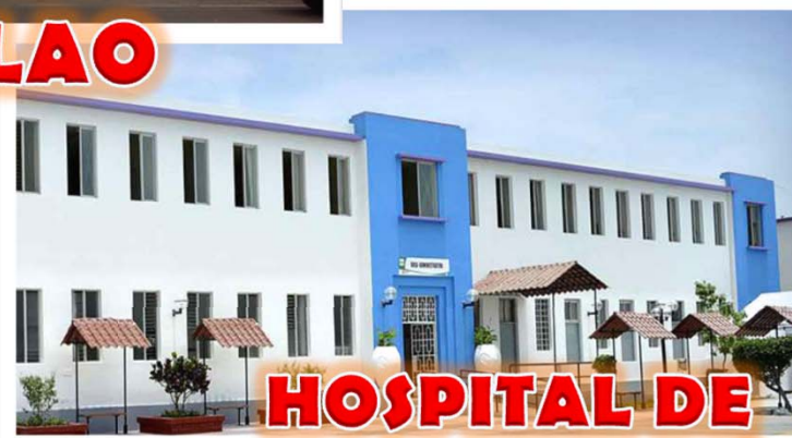
HOSPITAL DE REHABILITACIÓN