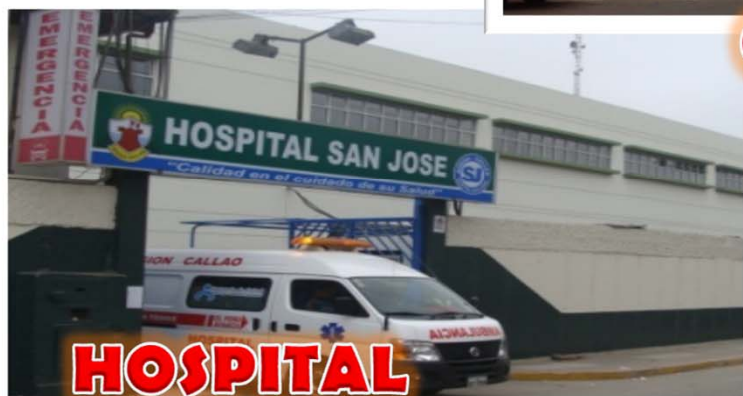
HOSPITAL SAN JOSÉ