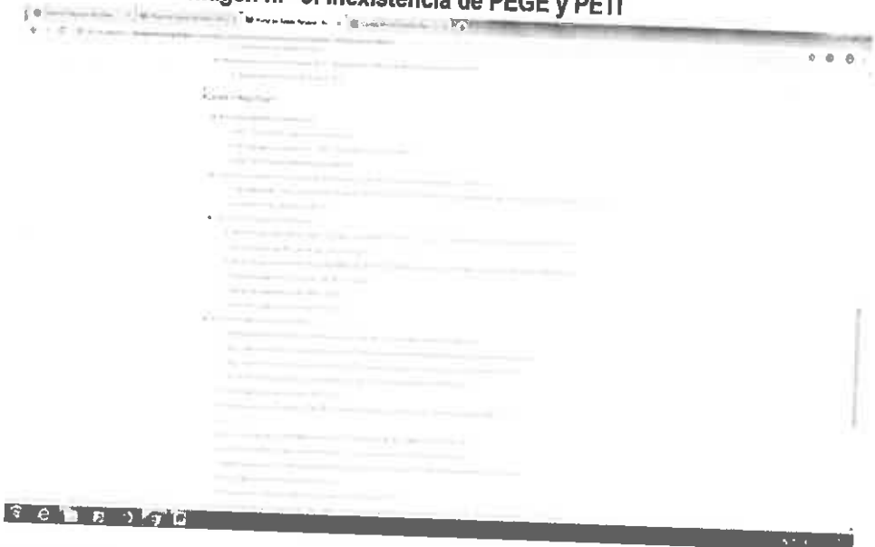
Imagen n.º 3: Inexistencia de PEGE y PETI

Handwritten blue initials and a signature.