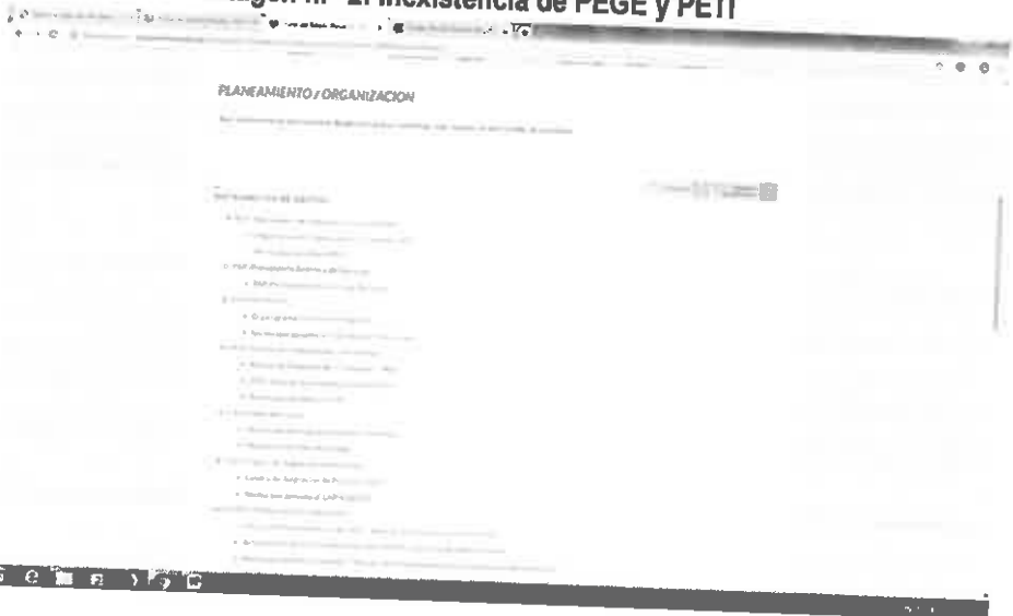
Imagen n.º 2: Inexistencia de PEGE y PETI

Handwritten blue initials and a signature.