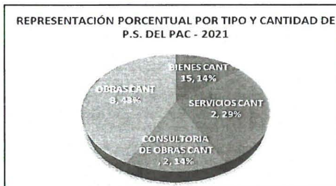
Gráfico 2 Representación porcentual por tipo y cantidad del PAC-2021