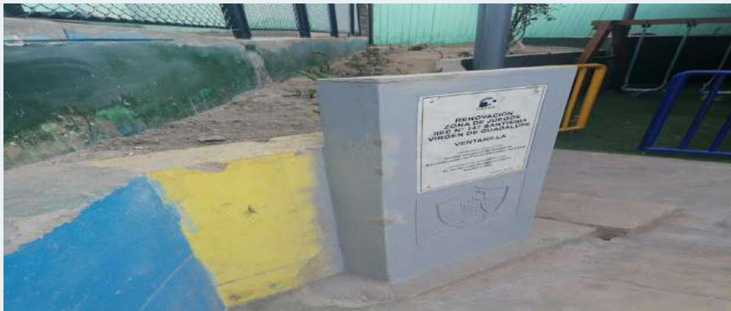
ANTES: Muros sin mantenimiento