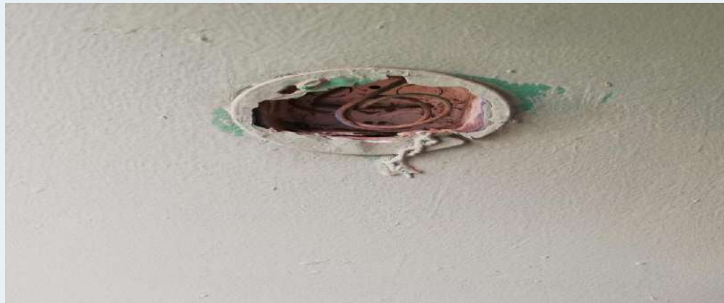
ANTES: Sócate sin colocar