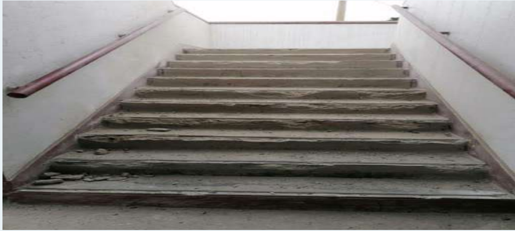
ANTES: Escaleras en mal estado