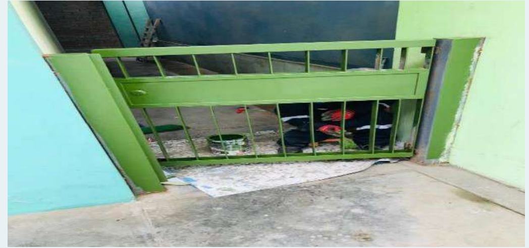
DESPUÉS: Aplicación de base anticorrosiva en estructuras metálicas