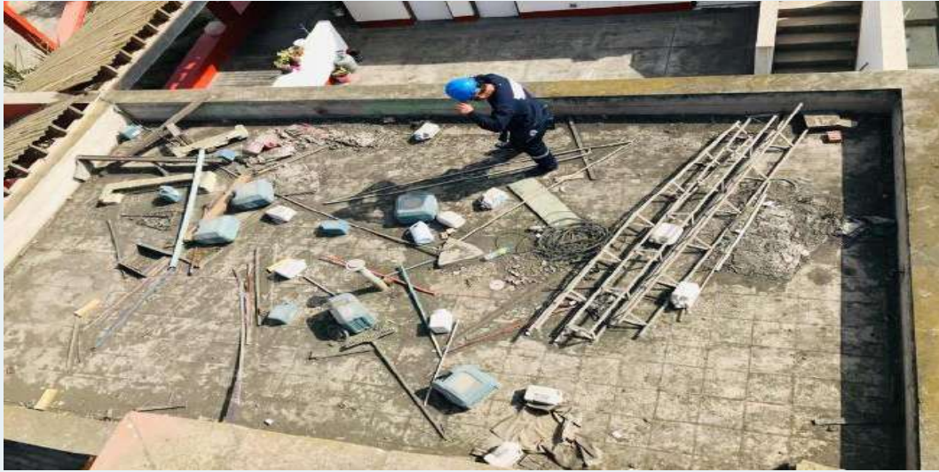
ANTES: Techos con residuos