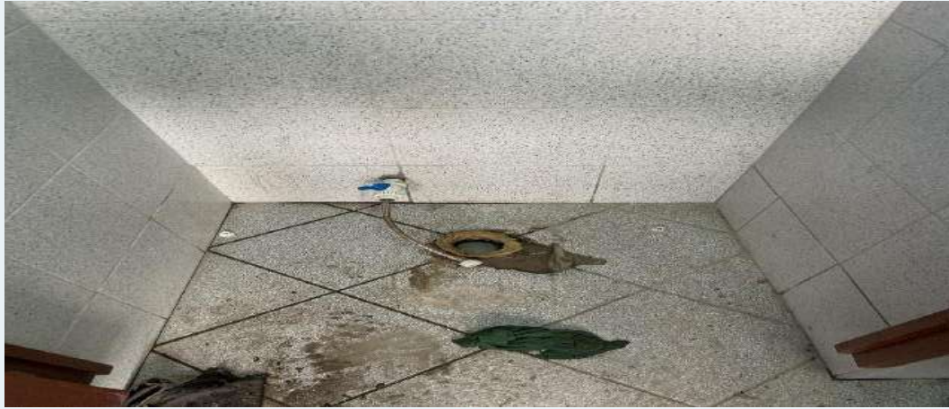
ANTES: Instalaciones Sanitarias, en mal estado