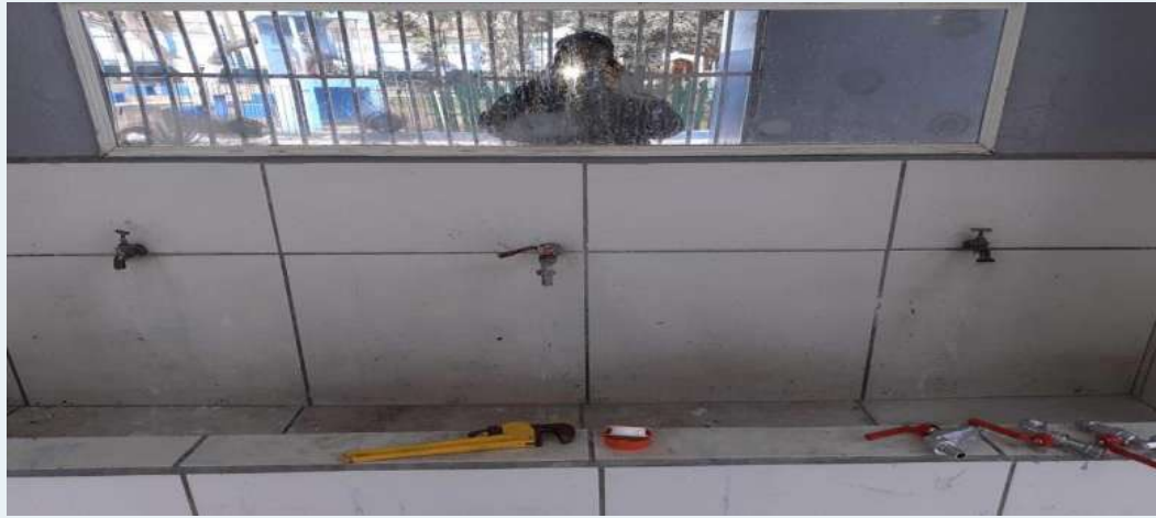
ANTES: Caños de lavaderos en mal estado