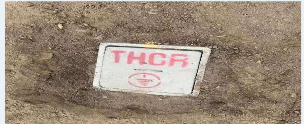
DESPUES: Cambio de caja de pozo a tierra