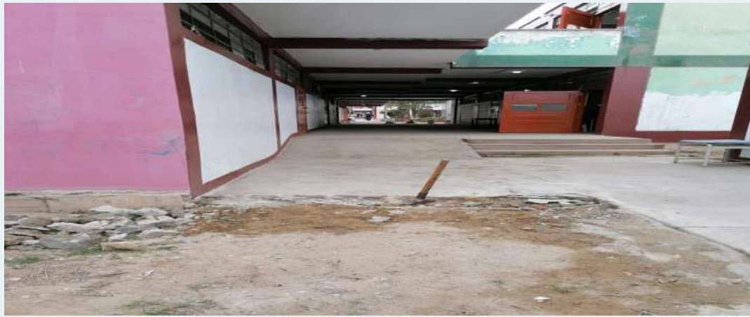
ANTES: Demolición de pisos