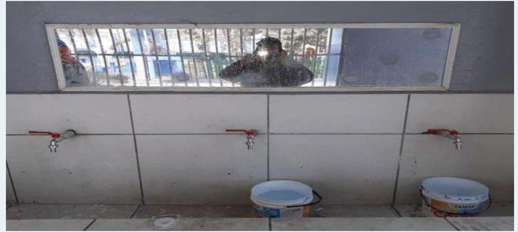
DESPUES: Cambios de caños