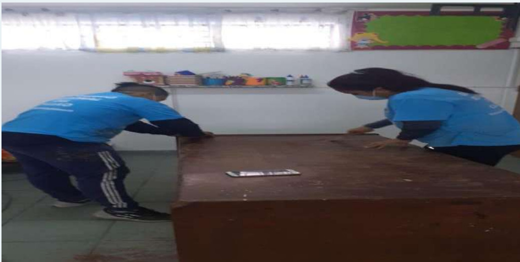
ANTES: Mesa con pintura deteriorada