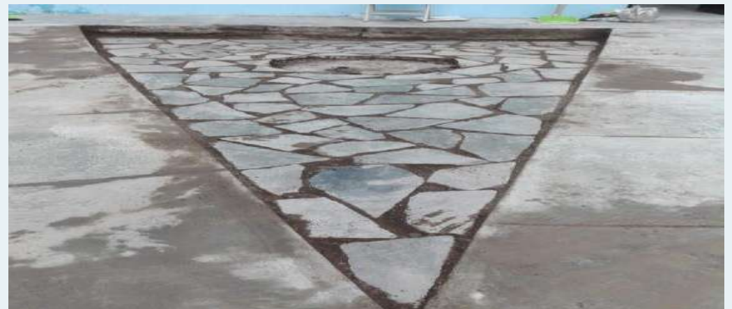
DESPUES: Reutilización de demolición en jardineras