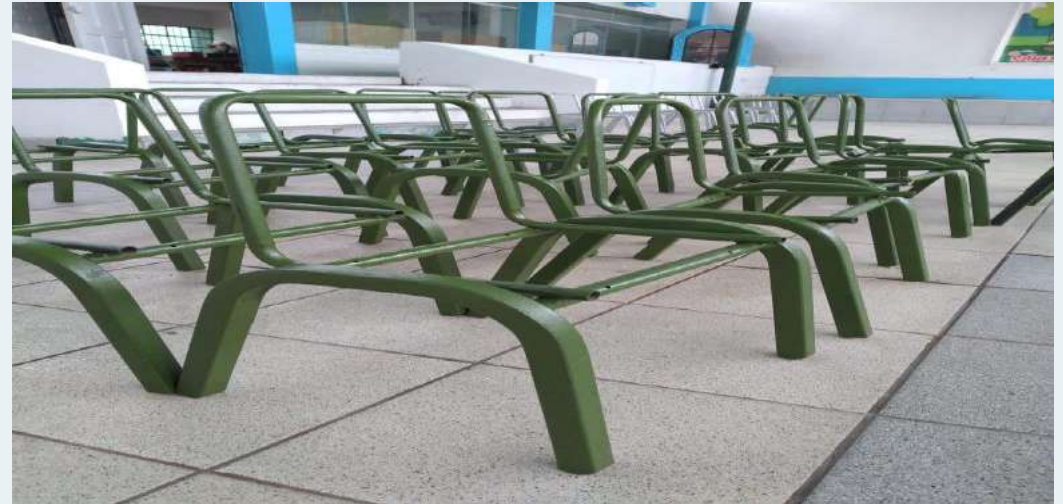
DESPUES: Aplicación de zincromato en sillas