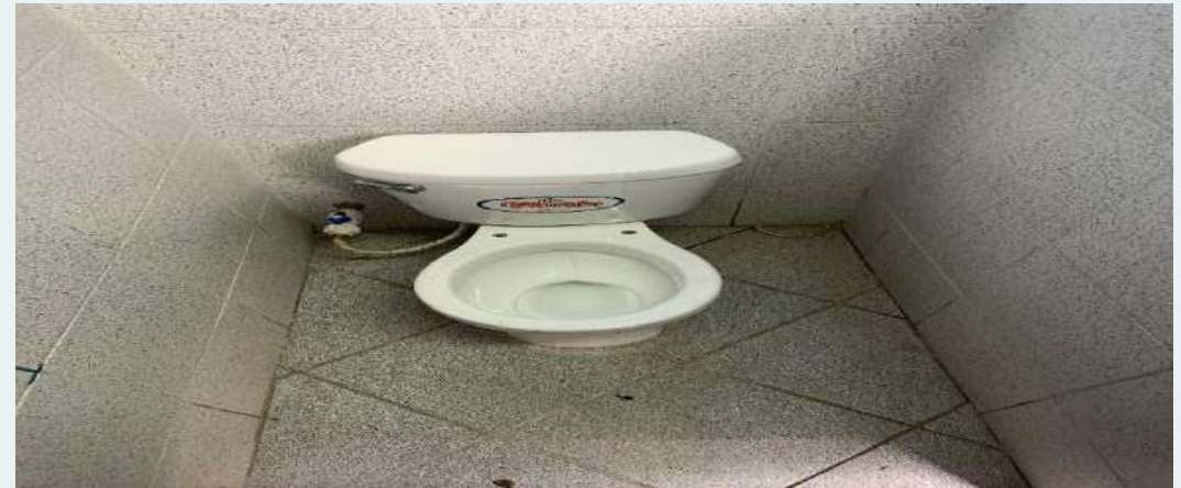
DESPUÉS: Instalaciones Sanitarias, cambio de inodoros completos.