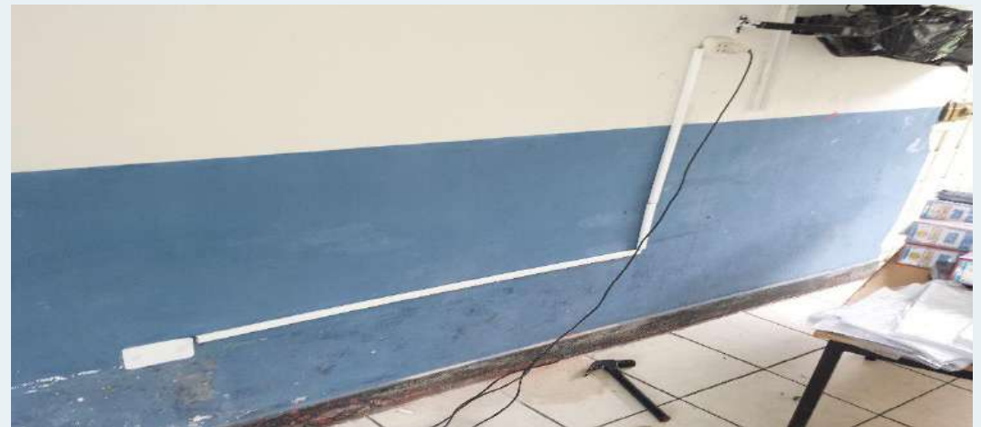
DESPUES: Instalación de canaletas