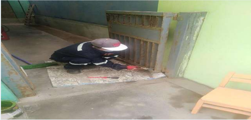
ANTES: Estructura metálica sin mantenimiento