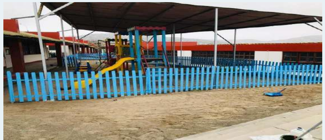
DESPUÉS: Pintado de cerco de madera