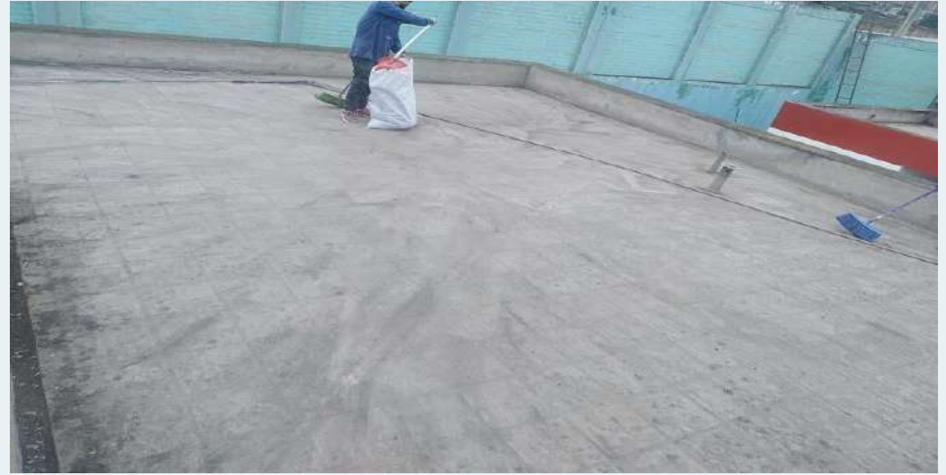
DESPUES: Limpieza de techos