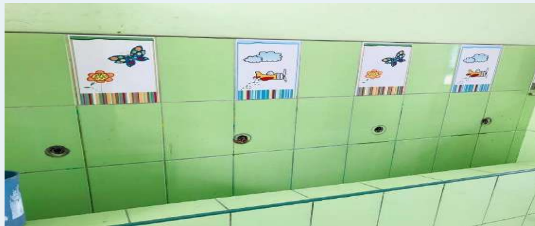
ANTES: Lavadero sin griferías