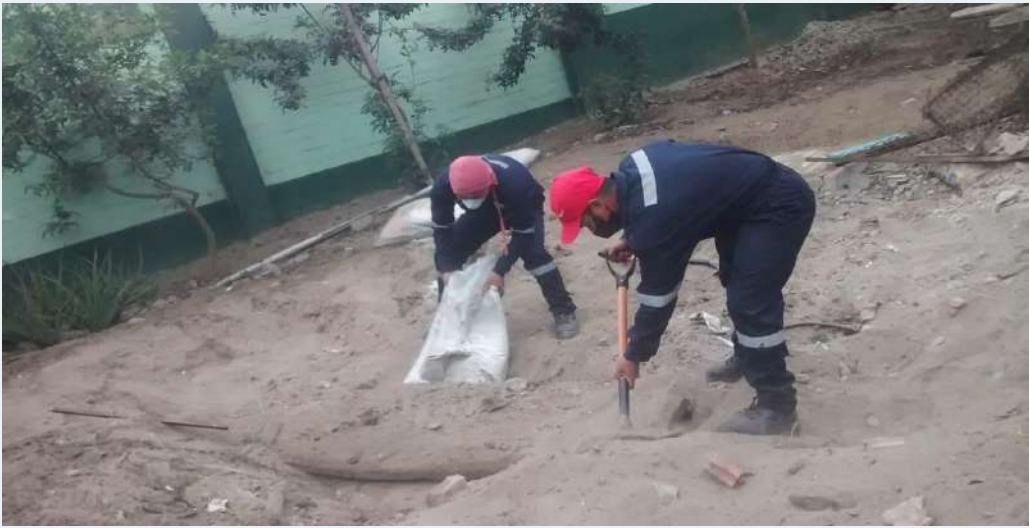
ANTES: Anulación de Pozo séptico