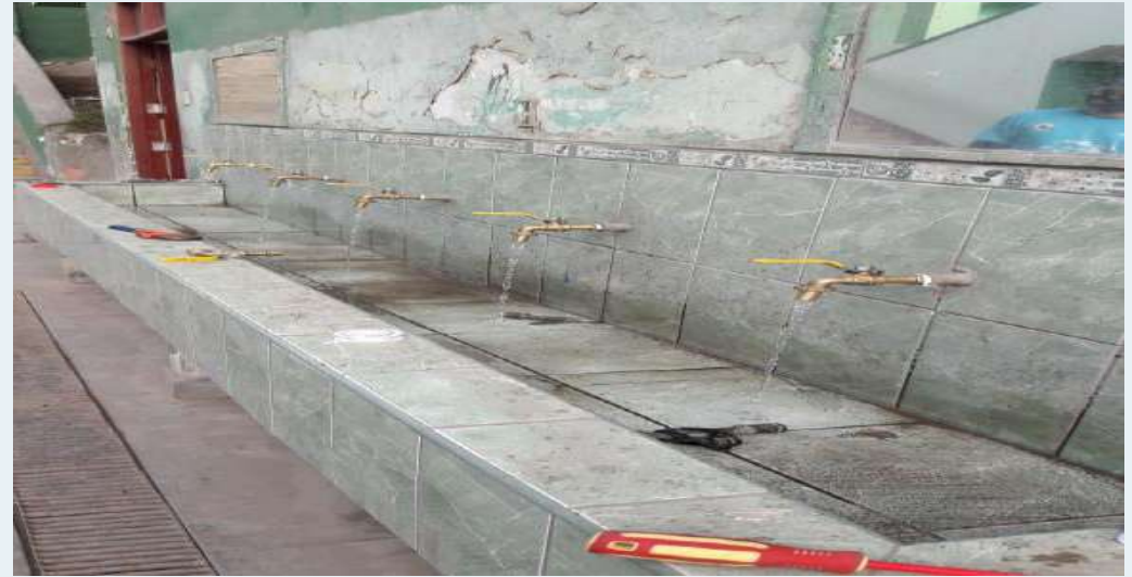
DESPUÉS: Cambio de caños