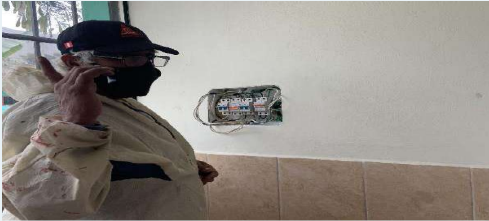
ANTES: Instalaciones Eléctrica, en mal estado