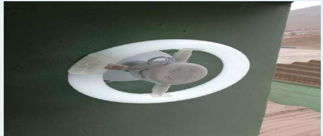
DESPUES: Colocación de sócate y fluorescente circular.