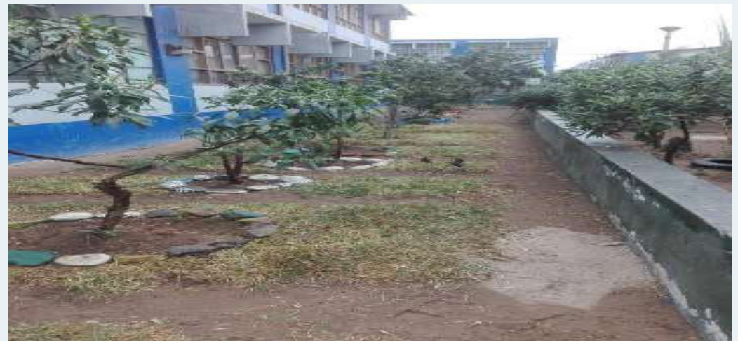
DESPUES: Podado de jardinería