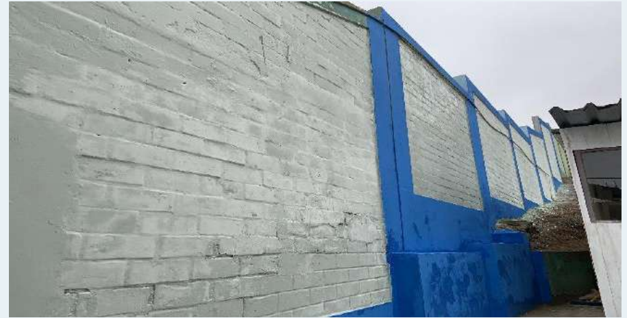
Después: rasqueteo, aplicación de sellador y pintado de muros