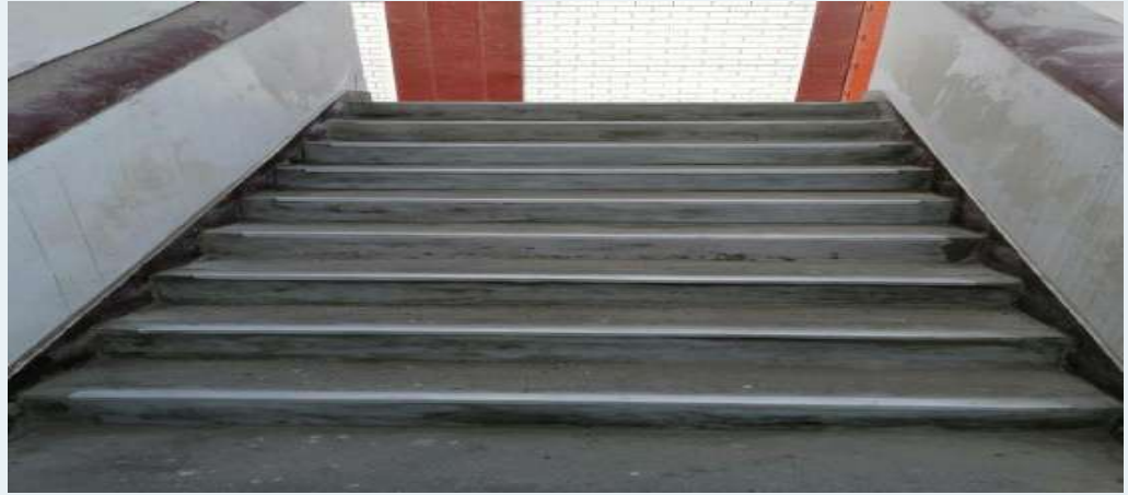
DESPUES: Resane y colocación de esquineros