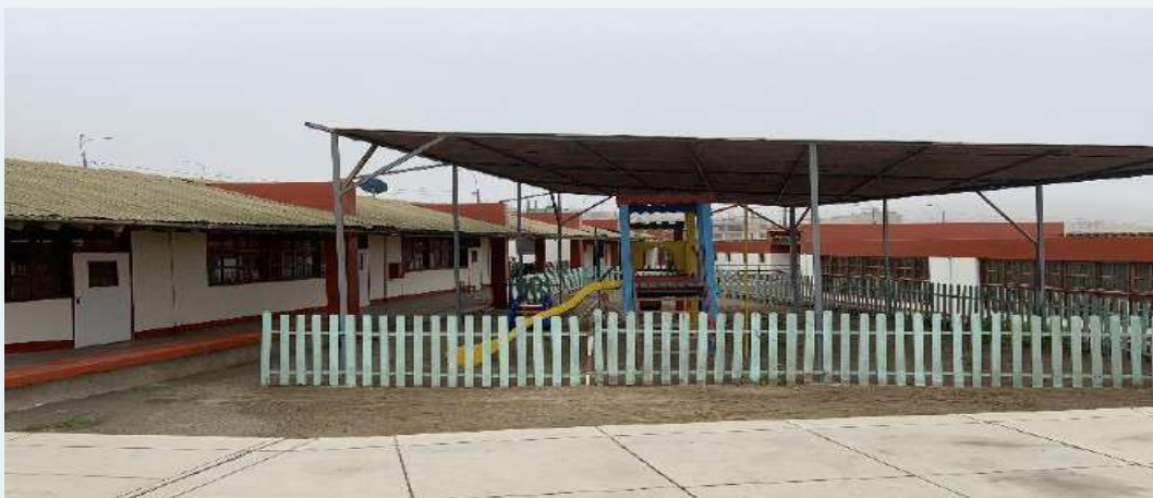
ANTES: Cerco de Madera con pintura desgastada