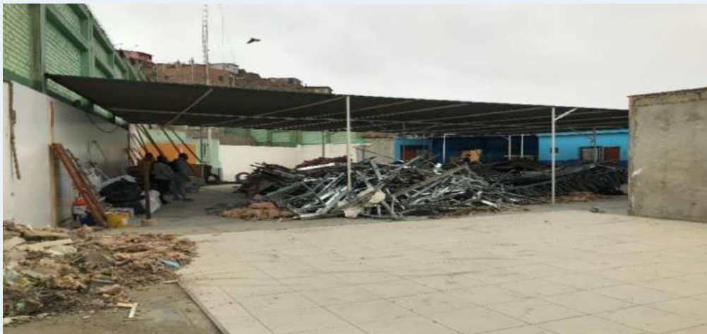
ANTES: Desmontaje de los módulos de Drywall .