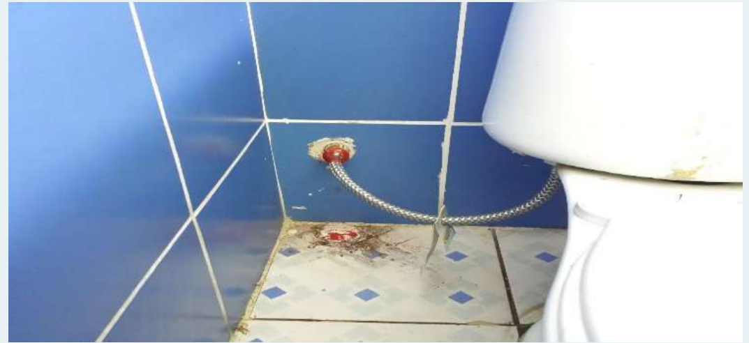
DESPUES: Instalación de tubo de abasto