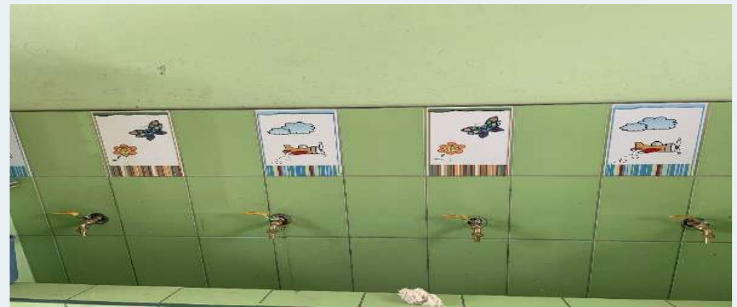
DESPUÉS: Instalaciones de griferías