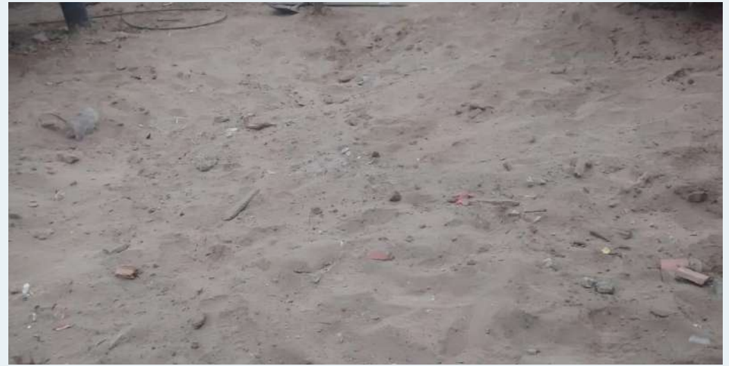
DESPUES: Pozo séptico anulado