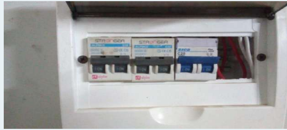
DESPUES: Instalaciones Eléctrica, mantenimiento de tableros eléctricos.