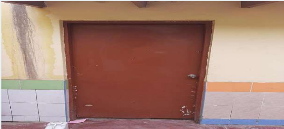
Antes: puerta de madera sin barnizar y deteriorada