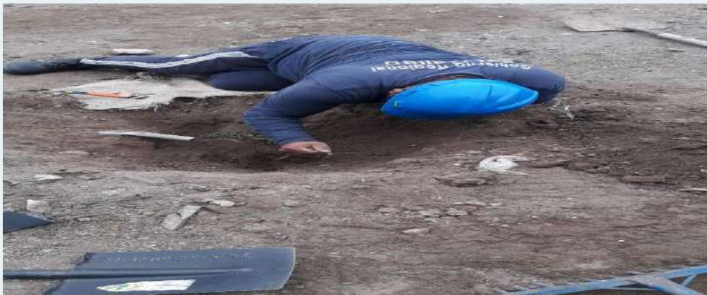
ANTES: Pozo a tierra deteriorado