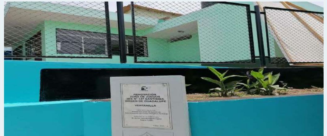
DESPUES: Muros lijados y pintados