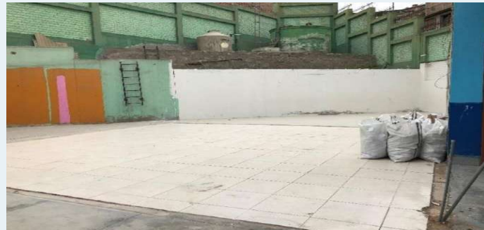
DESPUES: Módulos de Drywall libre de desmontaje.