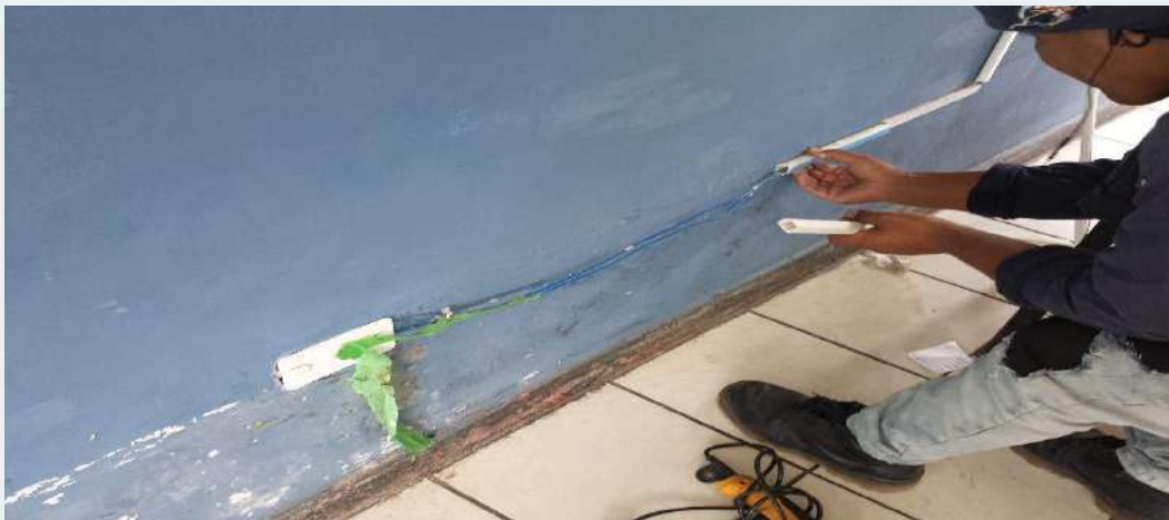
ANTES: Canaletas en mal estado