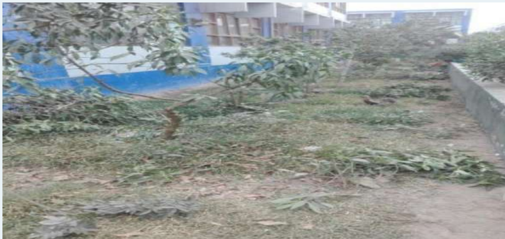
ANTES: Paisajismo sin mantenimiento