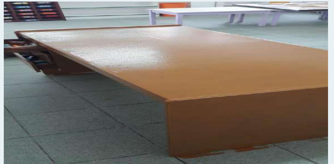
DESPUES: Pintado de mesa