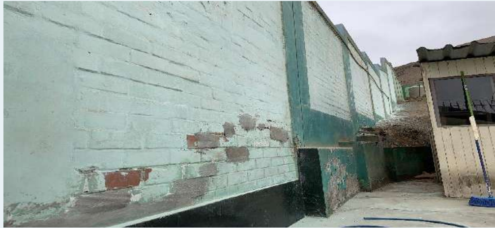
Antes: muros sin rasqueteo ni pintado