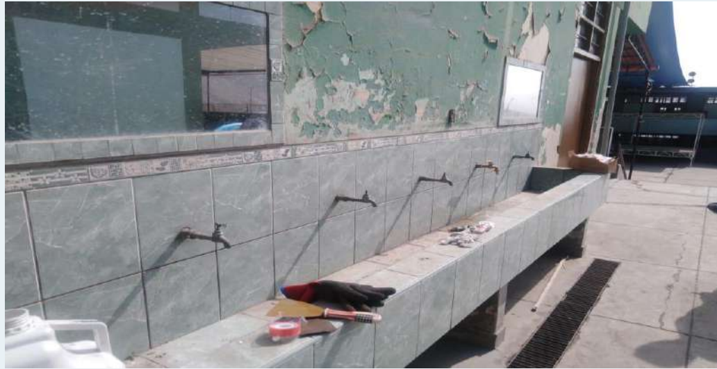
ANTES: Caños en mal estado