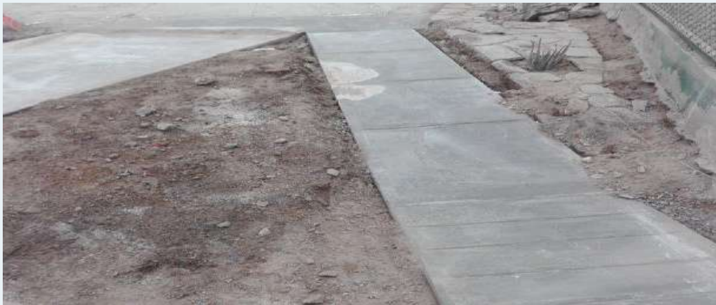
ANTES: Jardinera en mal estado