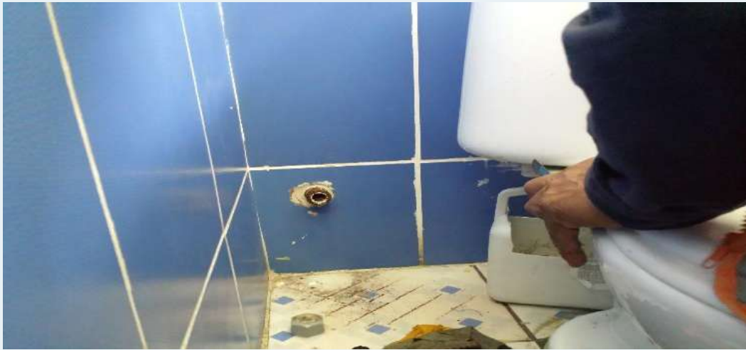
ANTES: Instalaciones sanitarias en mal estado