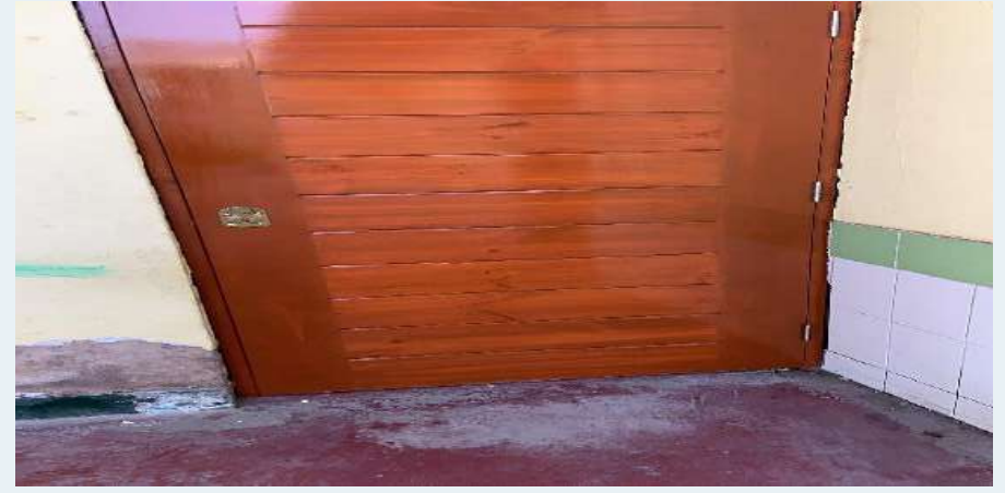
Después: Cambio de puerta de madera