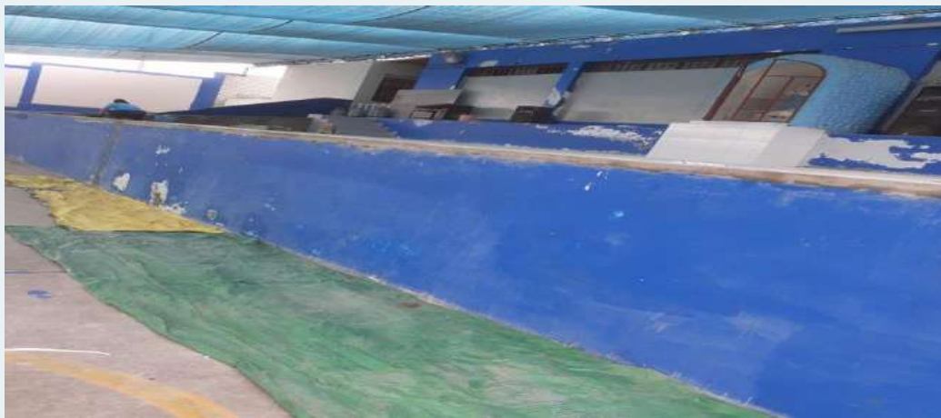
ANTES: Estrado en mal estado