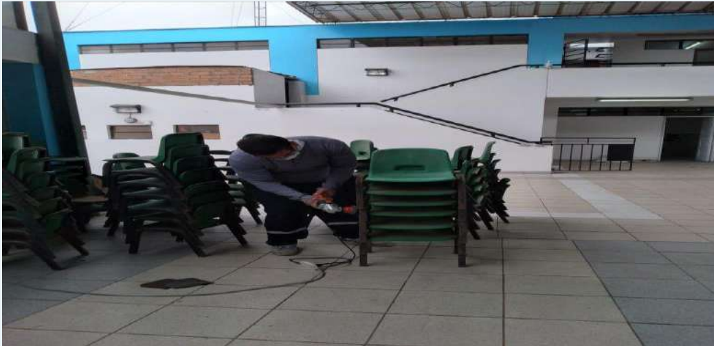
ANTES: Sillas sin lijar