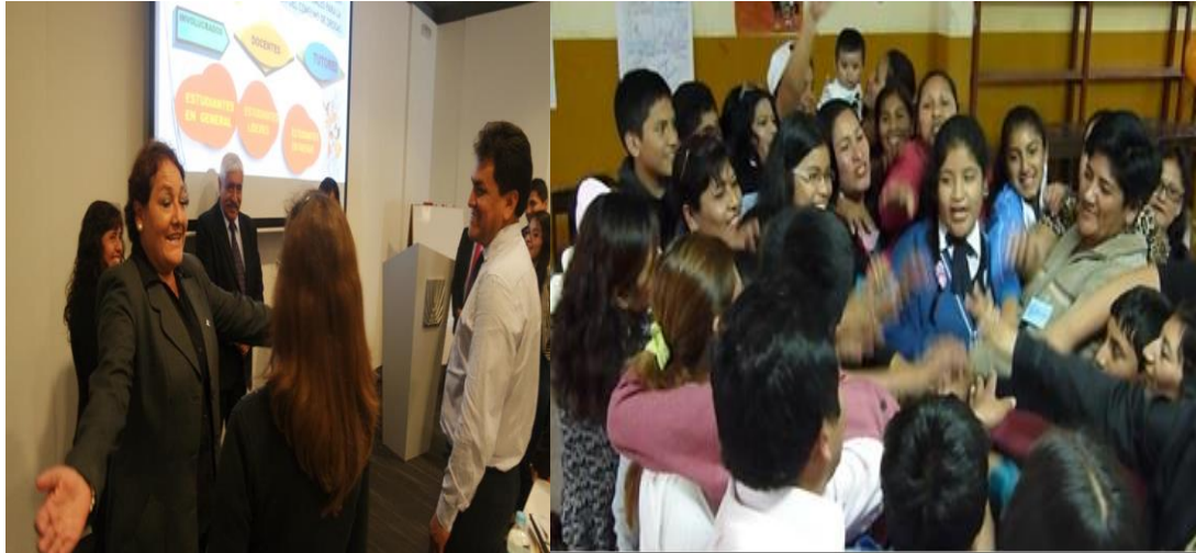
IE. Virgen de Fátima de Ventanilla alta.

implementación del programa Familias Fuertes en el Perú es una experiencia única que requiere ser documentada y analizada, dado que se trata del desarrollo de un programa a nivel nacional, el cual ha sido probado como altamente efectivo para la prevención del consumo de drogas y otras conductas de riesgo en adolescentes en diversos contextos.