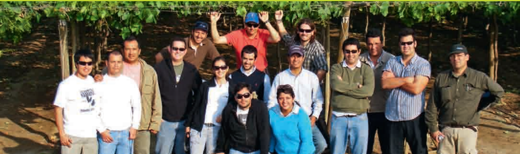
Alumnos de la primera promoción - Ica (2010)